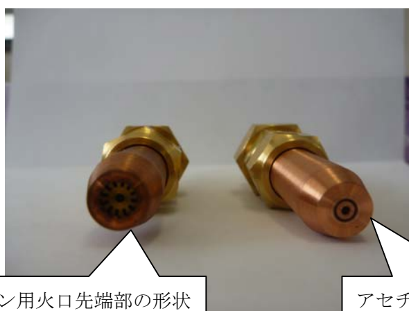
プロパン用火口先端部の形状