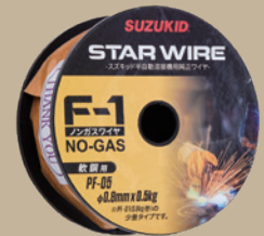
ノンガス軟鋼ワイヤ スターワイヤ 0.8Φ×0.5kg (型式: PF-05)

・本製品の迷彩柄には個体差があります。ケースパネルの部位によって模様の配置や色の濃淡が異なりますので、予めご了承ください。 ・台数限定のキャンペーンにつき、無くなり次第終了となります。