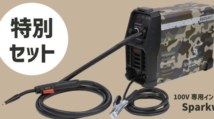
100V 専用インバータノンガス半自動溶接機 Sparkway80 カモフラ