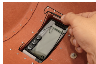
取付スプリング装着時 (P-2 内側)