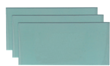
外側カバープレート (3枚入) PM-001 JAN:4991945 033627