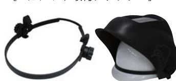
[ヘルメット取付アダプター]

P-567(1.5度/1枚入) P-568(2.0度/1枚入) P-569(2.5度/1枚入)