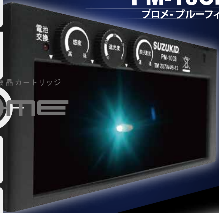
遮光度調整機能付液晶カートリッジ