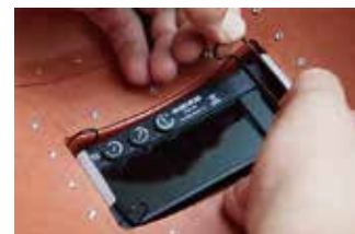
取付スプリング装着時 (P-2 内側)