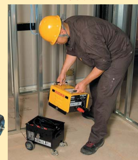
上下に分離できます。