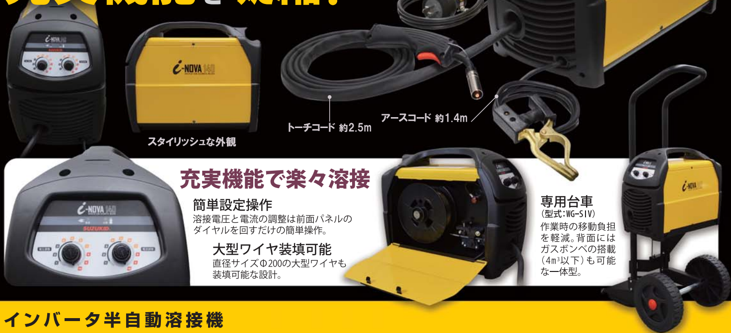
スタイリッシュな外観