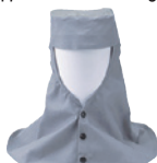
溶接用頭巾 P-526 JAN:4991945 025110