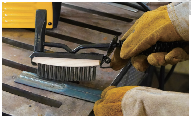
ワイヤブラシでスパッタの除去