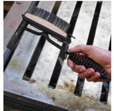
手に馴染むグリップ