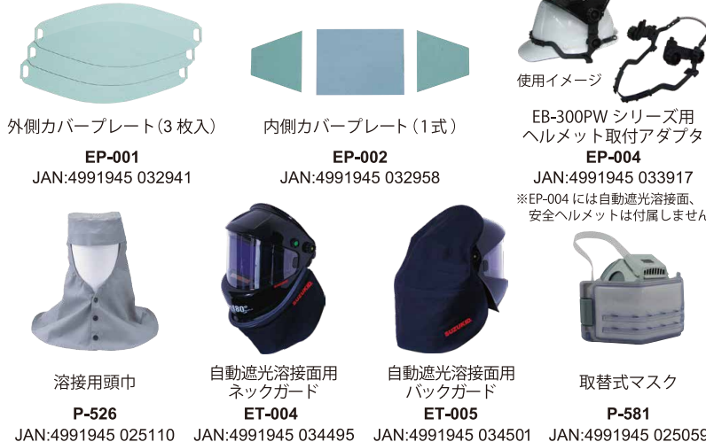
EP-001 JAN:4991945 032941