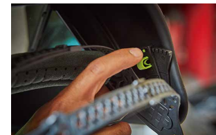
「E: ヘルメット角度の調整」のピン