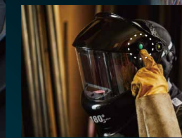
グラインドモードボタン 装着したまま溶接 / 切断モードからグラインドモードをワンタッチ切り替え