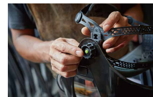
「C: 眼と面体距離の調整」のスイッチ