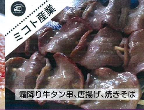
霜降り牛タン串、唐揚げ、焼きそば