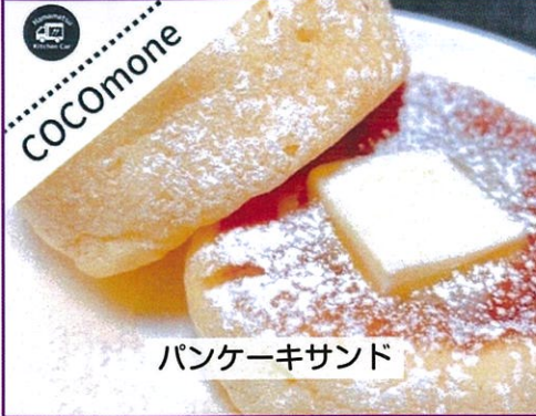
パンケーキサンド