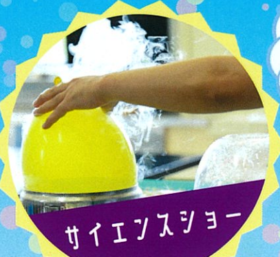
サイエンスショー