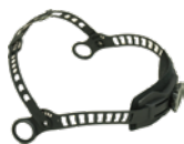
ヘッドギアバンド 型式: GM-003