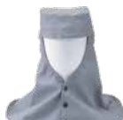
溶接用頭巾 型式: P-526