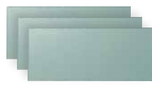
内側カバープレート (3枚入) 型式: EB-002B JAN:4991945 036482