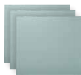
外側カバープレート (3枚入) 型式: EB-001B JAN:4991945 036475