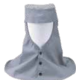
溶接用頭巾 型式: P-526 JAN:4991945 025110