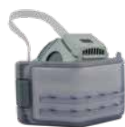
取替式防塵マスク 型式: P-581 JAN:4991945 025059