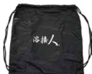
収納バッグ 型式: ET-006 JAN:4991945 035584