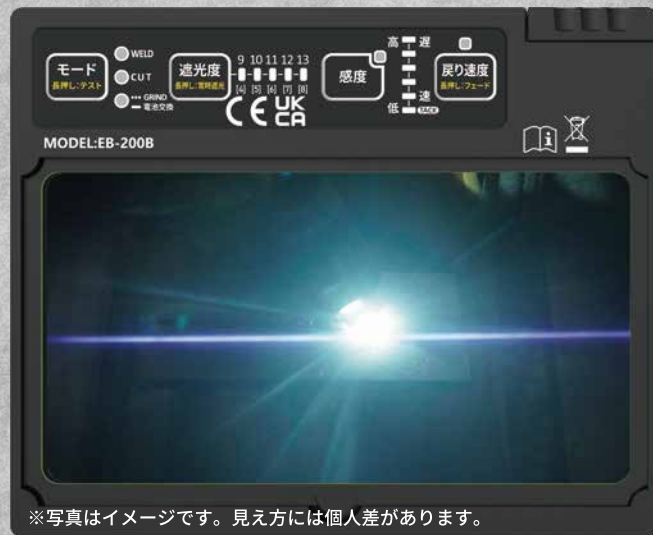
※写真はイメージです。見え方には個人差があります。